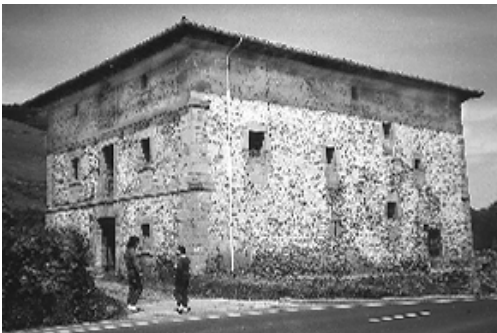
Fig. nº 11: Palacio junto a la Casa de Juntas de Abellaneda, en Sopuerta.