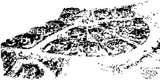
Fig. nº 6: Sdad. Coop. de Casas Baratas Buena Vista, (1925). Arqto. Tomás Bilbao.