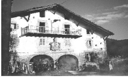
Fig. nº 5: Caserío de Berriz.