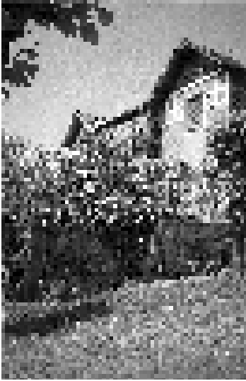
Fig. nº 13: Sdad. Coop. de Casas Baratas Talleres de Deusto, (1926). Arqto. Diego Basterra.