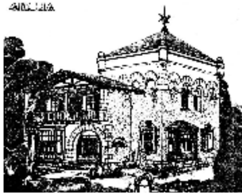
Fig. nº 10: Casa unifamiliar. Sdad. Coop. de Casas Baratas Empleados de Oficina de Bizkaia, (1924). Arqto. Tomás Bilbao.