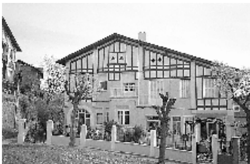
Fig. nº 3: Casa bifamiliar. Sdad. Coop. de Casas Baratas Buena Vista, (19125). Arqto. Tomás Bilbao.