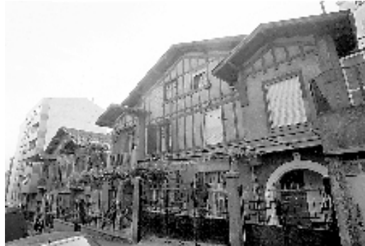
Fig. nº 7: Sdad. Coop. de Casas Baratas Obreros Panaderos. Arqto. Tomás Bilbao.