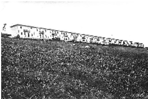
Fig. nº 2: Hilera de casas adosadas. Sdad. Coop. de Casas Baratas Empleados Tranviarios de Barakaldo, (1921). Arqto. Ismael Gorostiza.