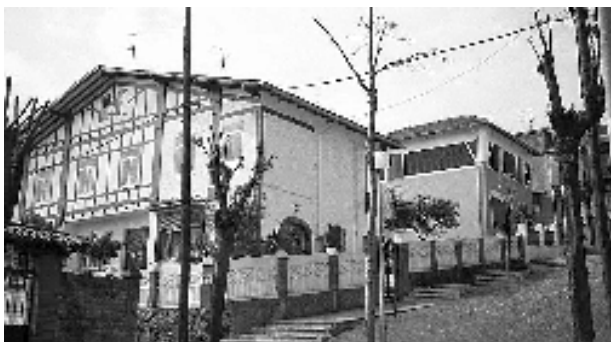
Fig. nº 8: Sdad. Coop. de Casas Baratas Empleados de Oficina de Bizkaia, (1924). Arqto. Tomás Bilbao.