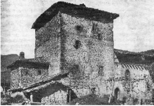
Fig. nº 9: Casa Torre Vizcaína.