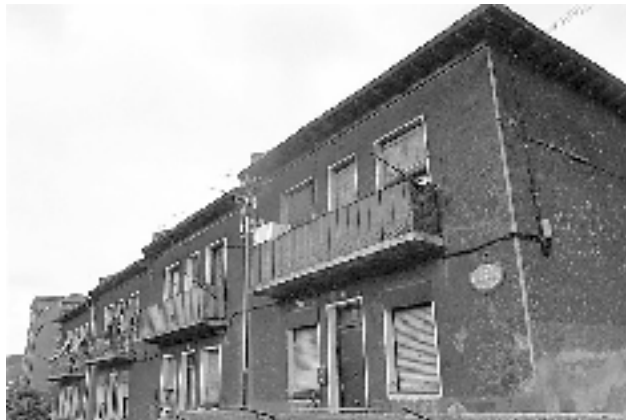
Fig. nº 15: Sdad. Coop. de Casas Baratas Doce Amigos, (1935). Arqto. Julio Sáez de Barés.