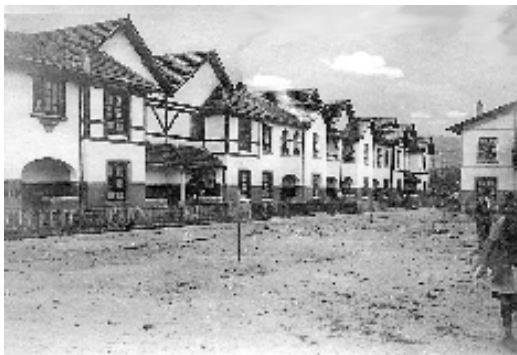
Fig. nº 1: Hilera de casas adosadas. Sdad. Coop. de Casas Baratas Diques de Euskalduna, (1925, Deusto). Arqto. Diego Basterra.