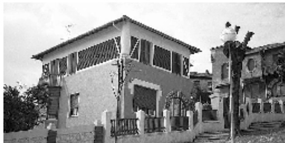
Fig. nº 12: Casa unifamiliar. Sdad. Coop. de Casas Baratas Empleados de Oficina de Bizkaia, (1924). Arqto. Tomás Bilbao.