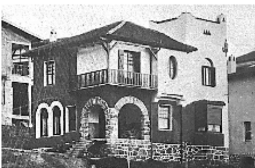
Fig. nº 4: Casa unifamiliar. Sdad. Coop. Casas Baratas de Emplea- dos de Oficina de Vizcaya en Zurbaran, (1924). Arqto Tomás Bilbao.